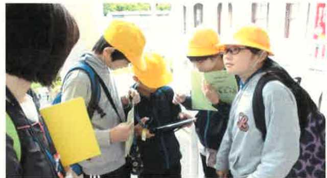
【6年生】社会見学（明治村） タブレットを活用し、明治時代の文化等について班で楽しく学ぶことができました。