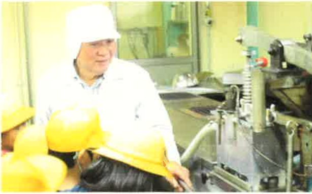
【3年生】伊藤製菓見学 「八百津せんべい」をおいしくつくる秘密を聞き取ることができました。