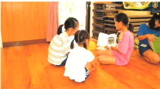
【5年生】和知保育園訪問 年長児に絵本の読み聞かせを行いました。次回は11月9日（木）に予定しています。