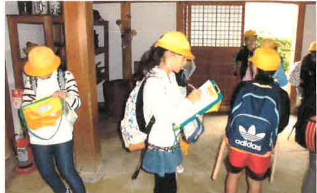
【4年生】社会見学（木曽三川公園） 低地に生きる人々の知恵や苦勞を聞き取ったり発見したりすることができました。