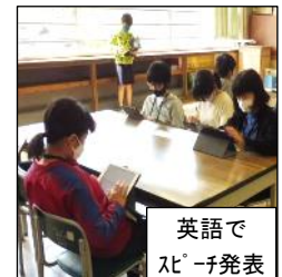
英語でスピーチ発表

今年1月からの5ヶ月で、子供達にとっても、職員にとっても、タブレットはなくてはならないものになりつつあります。1年生も使い方を学習し、じょじょに慣れていきます。