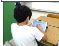
課題を早く終えて「eライブラリ」