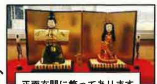
正面玄関に飾ってあります

2月12日頃に、家庭におけるタブレット端末使用の時間等を話し合っていたと思います。子供が「〇〇を使いたい。」と思っている時こそ話し合いのチャンスです。まず、小学生でも中学生でも、高校生でも、家庭におけるルールは、押しつけでなく、家族で話し合って決めなければいけないと思います。また、「このルールは誰のために、何のためにあるのか」を確認して話し合うことも大切です。そして、「ルールを守るものは、ルールに守られる」ことも教えながら、これからの社会を生き抜く力を身に付けさせたいです。